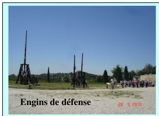
Engins de défense