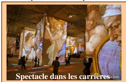
Spectacle dans les carrières