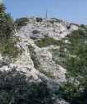
La Croix de Fer : le fameux sommet mythique de Marseilleveyre.

À l'occasion de mon anniversaire (le 7 août), ma sœur qui connaît mon amour pour la Provence de Pagnol et de Giono, m'a fait parvenir depuis sa retraite parisienne une revue éditée par le Figaro à la mémoire de la vie et l'œuvre du regretté Marcel Pagnol. Et me voilà reparti à vagabonder dans ce que j'appellerai les trilogies : l'une qui fit la gloire de Raimu et l'autre qui relate l'enfance du petit Marcel « le Château de ma Mère », « la Gloire de mon Père », « le Temps des Amours » !!! Me voilà à