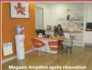
Magasin Amplifon après rénovation

Voilà l'affiche très incitative et très attrayante que proposait notre poissonnier à la populations de Ste Anne, pour ces fêtes de fin d'année 2015. Comme quoi l'art du pêcheur peut se combiner très bien avec le savoir-faire commercial.