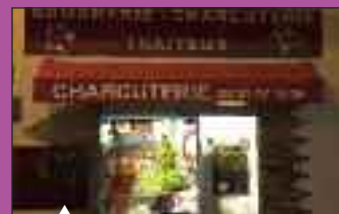
Boucherie Charcuterie Grassi