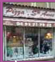
Pizza Ste Anne