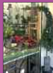
Le Bazar Fleuri, Place Bavarel