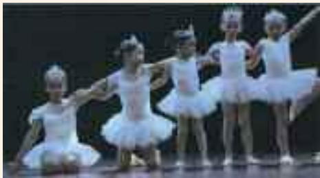
Le jeu et la joie sont dans le travail. Vive ces nouveaux artistes !