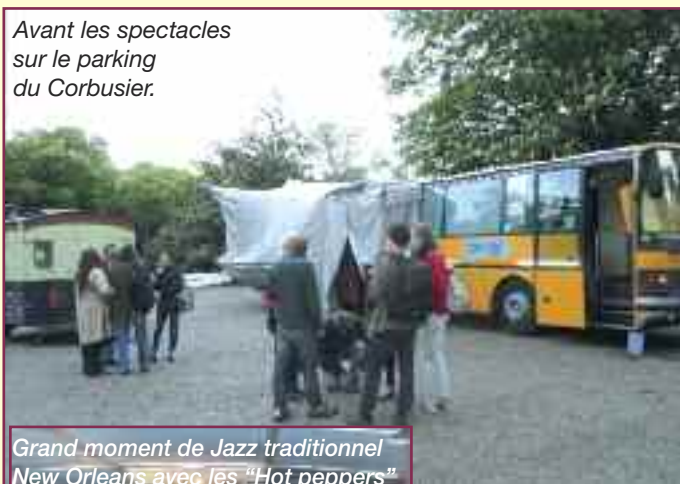
Grand moment de Jazz traditionnel New Orleans avec les "Hot peppers"