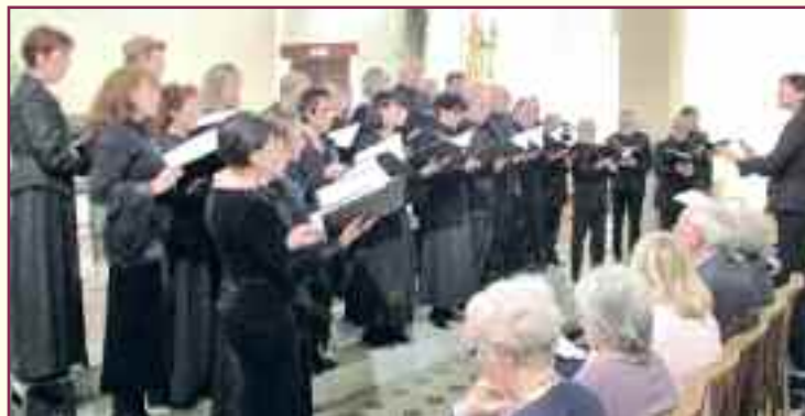
L'ensemble choral Philharmonia dans le chœur de l'Eglise de Ste Anne