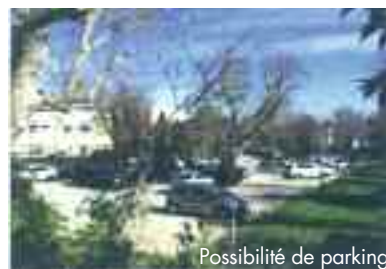
Possibilité de parking

Maison du Bâtiment 344 bd Michelet & 1 bd Luce 13009 Marseille Tél. 06 61 74 63 75 e-mail : actegourmet@gmail.com