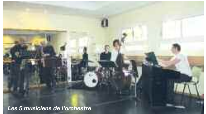
Les 5 musiciens de l'orchestre