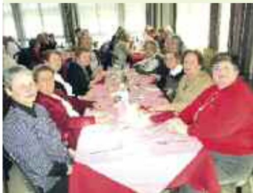
2 tablées qui reflètent la bonne ambiance.