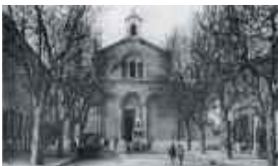
C'est la Place Baverel, fleuron de notre Quartier, qui a bénéficié en premier de l'éclairage public au gaz, lorsqu'il est arrivé à Ste Anne, par un lampadaire en son milieu.

En 1880 débute un chantier jugé à l'époque gigantesque : c'est la pose d'une conduite de gaz jusqu'à Mazargues. À l'époque tout était fait à la main, y compris le terrassement et si l'on trouvait du rocher on le cassait à la main : c'est dire l'importance d'un chantier de cette taille. Bien entendu cette canalisation est passée par Sainte-Anne, permettant à quelques rares et riches personnes de se raccorder à cette nouvelle énergie.