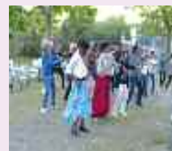
Groupe Salsa, très entraînant

Vous souhaitez partager un moment d'échange convivial, autour d'un café ou d'un thé, c'est possible !