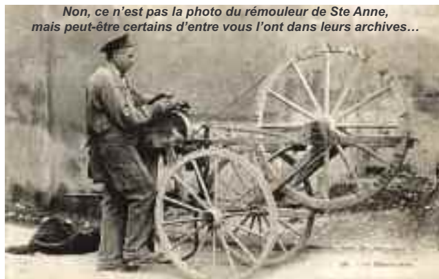
Non, ce n'est pas la photo du rémouleur de Ste Anne, mais peut-être certains d'entre vous l'ont dans leurs archives...

Nous avons eu à Sainte-Anne notre rémouleur qui, justement venait s'installer devant la boucherie pour rénover les couteaux de cet artisan mais aussi ceux des autres commerçants et même ceux des particuliers. C'était un personnage sorti de la légende, avec des vêtements de travail, de grosses chaussures montantes et un chapeau à très larges bords qui le protégeait du soleil et de la pluie. Il avait un autre tablier de cuir et parfois une petite cape de cuir pour se protéger des petites pluies. Il était invisible par grosses pluies. Son outil de travail était un charretton qu'il poussait. Il apparaissait comme étroit et haut. À bonne hauteur, il y avait la fameuse meule dont la partie basse était enfermée dans un cache en tôle qui contenait de l'eau. Au-dessus de la meule, un petit réservoir contenant de l'eau était muni d'un minuscule robinet qui pouvait couler sur la meule. À l'origine, pour faire tourner la meule il y avait une pédale. Il fallait donner à la main une impulsion à la meule pour la lancer et ensuite appuyer fermement