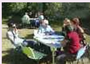
Le stand de la caravane citoyenne