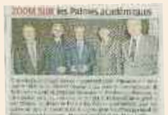
extrait de l'article du journal la Provence