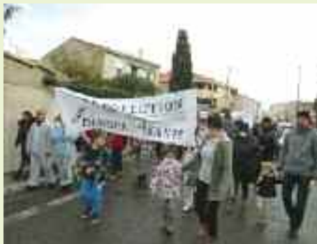
Exemple d'une banderole significative des motifs de cette mobilisation

Cette manifestation a réuni 300 personnes au dire des observateurs et de la presse régionale. Le CIQ de Sainte-Anne y était naturellement représenté, car nous sommes voisins et concernés.