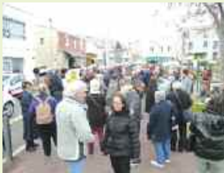
Photos de la foule nombreuse