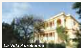
La Villa Aurélienne

Et pour la première fois depuis que nous organisons ces sorties, le restaurateur ne...nous attendait pas !...Nous faisons contre mauvaise fortune bon cœur et attendions avec patience que notre hôte nous concocte un repas de substitution au demeurant très bon mais qui nous faisait perdre pas mal de temps, ce qui nous privera de la visite de la chapelle Cocteau initialement prévue. Autre mauvaise surprise, à l'évidence ça n'était pas notre jour, la Cathédrale , dont la visite était également prévue, était en travaux