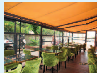
Intérieur de la terrasse