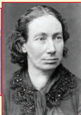
4 Portrait de Louise Michel