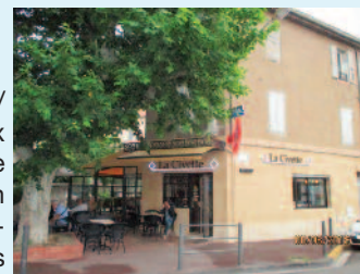
Vue d'ensemble de la façade.

Ils ont tout refait du sol au plafond-La famille JULIEN qui a repris ce Bureau de Tabac/Bar Restaurant il y a 11 ans a bien développé ce commerce – Au terme de 7 semaines de travaux l'Établissement a réouvert le 1er mars et tout a été refait : nouvelle cuisine aux normes / nouvelle terrasse en dur plus confortable, au design coloré- la toile de toiture orange donne l'impression de soleil même quand il pleut- bien chauffée l'hiver comme il se doit, extension possible sur le trottoir l'été – L'intérieur aussi a été refait : débit de tabac, vente de timbres fiscaux et de timbres postes - Ouvert tous les jours de 6H30 à 20H – Fermé le dimanche –Restaurant tous les midis.