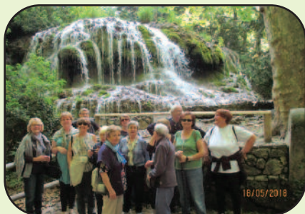
Le groupe sous la cascade rafraîchissante du Moulin de Cuges.