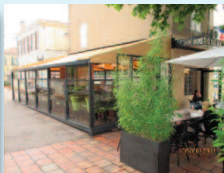
Vue de la terrasse rue Thieux