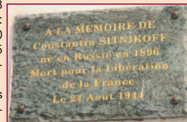
La Plaque du Résistant Constantin Sitnikoff

Les Commémorations permettent de penser à toutes les victimes de ces tragédies et de réfléchir à leur cause, afin qu'un jour peut-être, les leçons de l'histoire permettent d'en éviter de nouvelles.