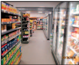
Espace intérieur- la vitrine extérieure n'est pas terminée. La photo paraîtra dans le prochain numéro

Par extension en reprenant les locaux occupés par l'ancien commerce la boucherie de M et Mme Grossi ce commerce d'alimentation et de fruits et légumes occupe maintenant une surface de 130M2.