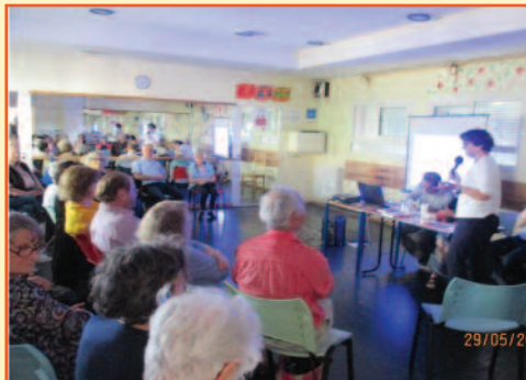
Les 50 ans de Mai 1968 avec les slogans, mais un peu de rétrospective est très utile

En 1871, elle participe activement aux événements de la Commune de Paris, autant en première ligne qu'en soutien. Capturée en mai, elle est déportée en Nouvelle-Calédonie où elle se convertit à la pensée anarchiste. Elle revient en France en 1880, et, très populaire, multiplie les manifestations et réunions en faveur des prolétaires. Elle reste surveillée par la police et est emprisonnée à plusieurs reprises, mais poursuit son militantisme politique dans toute la France jusqu'à sa mort'.