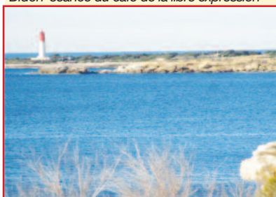
2 Sortie des AIL Côte Bleue le 4 février entre Sausset et la Couronne