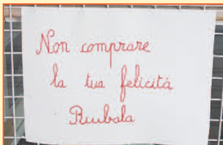
N'achète pas ton bonheur Vole le !