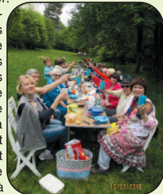
La tablée du repas champêtre

C'est donc une vingtaine de curieux qui se sont retrouvés là, et qui ont remonté les rives du Fauge un des affluents de l'Huveaune. Dès le départ, sous un toit de verdure constitué d'une multitude d'essences très rares pour notre région comme les érables, les cèdres, les épicéas ...etc...etc... nous découvrons les vestiges de ce qui fut en quelque sorte une mini zone industrielle dès le 17ème siècle. Foulon, Moulins à papier et à grains, des ruines, récemment restaurées témoignent de ce passé. Plus loin c'est la petite Chapelle Saint Martin, première église paroissiale de Gémenos le Vieux datant du 13ème siècle. Ensuite nous arrivons à l'Abbaye de Saint Pons après avoir admiré le Moulin de Cuges et sa magnifique cascade. Très bien restaurée et entretenue, cette grande bâtisse accueille aujourd'hui des concerts de musique sacrée et des expositions. A quelques mètres à peine la source du Fauge s'échappe à gros bouillon d'une anfractuosité de la montagne. Un petit effort d'un kilomètre environ et nous arrivons au Gour de l'Oule, magnifique petite cascade qui s'abrite sous une voûte de feuillages la rendant invisible au promeneur non averti.