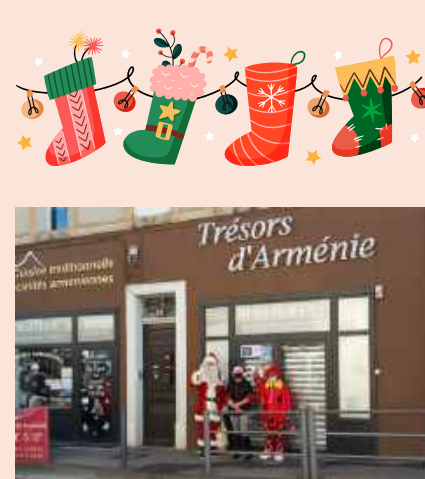
Devant le restaurant et le magasin «Trésor d'Arménie» Av. de Mazargues.