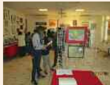
Visite des Passerelles 1 et 2 des Ecuireuils