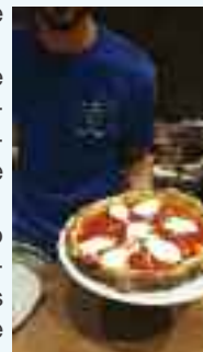
Le Maître Pizzaiolo