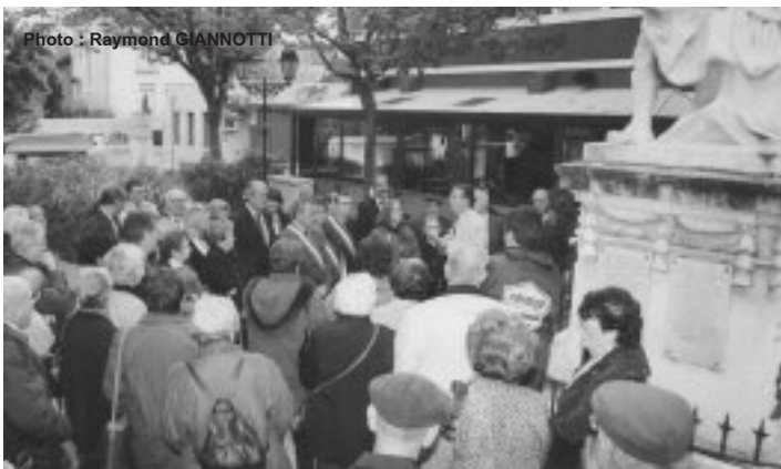
Participants à la commémoration attentifs à l'évocation de cette guerre 1914 /1918.

Tous les participants à cette commémoration, qui étaient disponibles, ont été invités au pot de l'amitié dans la salle du Tempo.