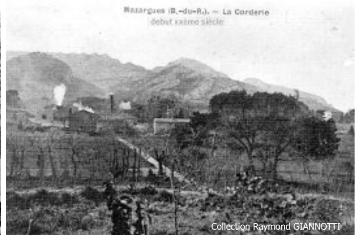
Vue des usines au début du XXème siècle