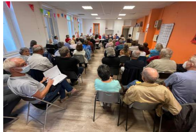
Vue de l'assistance

« La Ville de Marseille et la Mairie du 6/8 souhaitent rénover leurs parcs et jardins, dont le Parc Bonneveine, en intégrant une démarche de participation des usagers, pour faire de Marseille une ville plus verte et plus harmonieuse. »