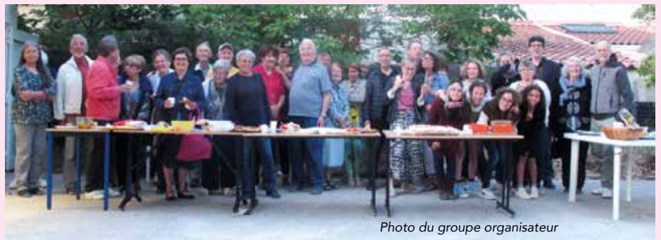
Photo du groupe organisateur